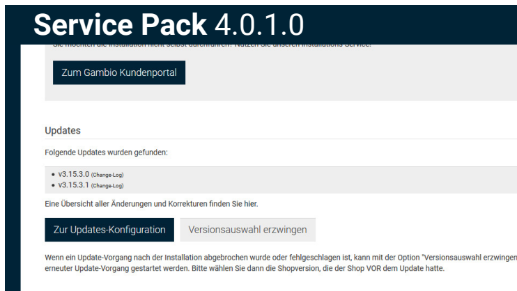
Abbildung 2: Anzeige der verfügbaren Updates